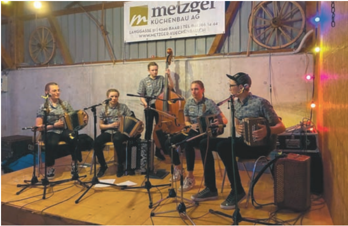
Für musikalische Unterhaltung war gesorgt

Ein geselliger Musikabend, welcher auch in diesem Jahr wieder mit dem Einzug der Trychler-Gruppe Rottenschwil unterstrichen wurde. Trychler-Klänge, Ländler Musik, viele gute Leute und eine Prise TV Rottenschwil, das perfekte Rezept für gute Laune und diese zu verbreiten. Als Verein war es uns allen erneut eine besondere Freude, mit euch dieses Fest feiern zu dürfen. Der treuen und neuen Besucherschaft ein herzliches Dankeschön.