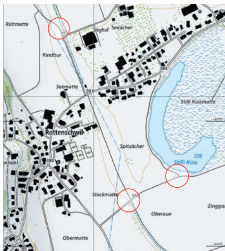
Karte mit den Standorten

Die bisherigen Bänke wurden vor rund 20 Jahren durch die Senioren in Fronarbeit erstellt.