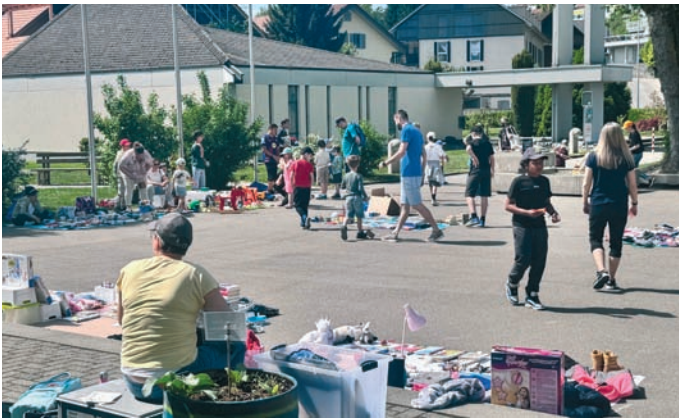
Der Flohmarkt war gut besucht

Nachdem nun die Umgebungsgestaltung und der Innenausbau mit Küchenzeile fertiggestellt waren, konnte der Anbau am 2. Mai 2026 eingeweiht werden.