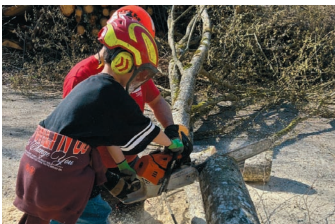
Beim Umgang mit der Säge ist Vorsicht und Schutz gefragt