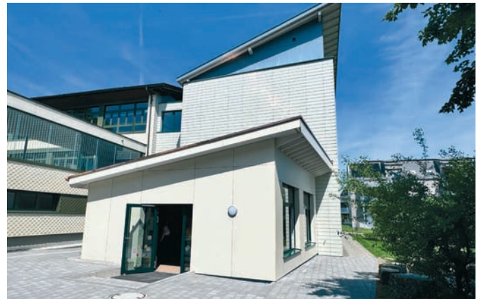
Der neue Kindergarten-Anbau von aussen

Einweihung Kindergarten-Anbau mit Familien-Band-Flohmarkt und Tag der offenen Tür bei den Tagestrukturen am Samstag, 02. Mai 2026