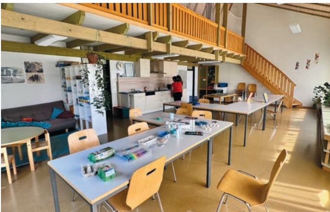
Räumlichkeiten der Tagesstrukturen

Dies geschah in Zusammenarbeit mit dem Familienverein Familie-Band, der einen Flohmarkt und Imbissstand organisierte, und mit den Betreuerinnen der Tagesstrukturen, welche ihre Räumlichkeiten zeigten und die Anwesenden mit Kaffee verwöhnten.