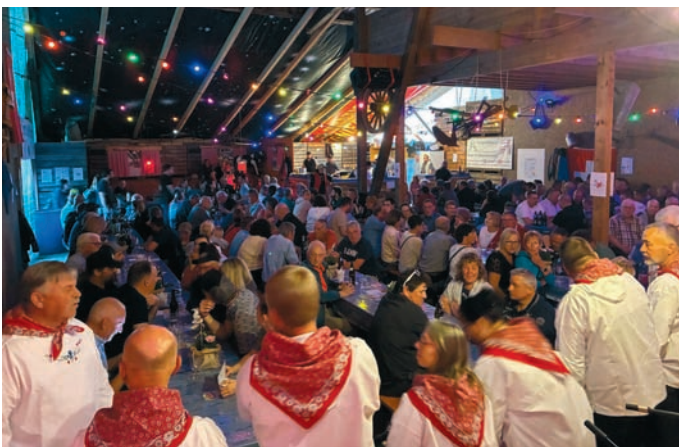
Ein gelungener Abend

Ein geselliger Musikabend, welcher auch in diesem Jahr wieder mit dem Einzug der Trychler-Gruppe Rottenschwil unterstrichen wurde. Trychler-Klänge, Ländler Musik, viele gute Leute und eine Prise TV Rottenschwil, das perfekte Rezept für gute Laune und diese zu verbreiten. Als Verein war es uns allen erneut eine besondere Freude, mit euch dieses Fest feiern zu dürfen. Der treuen und neuen Besucherschaft ein herzliches Dankeschön.