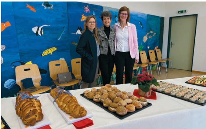
Apéro nach dem festlichen Gottesdienst in Rottenschwil

Der Vorstand des Kapellenvereins bedankt sich herzlich bei allen, die an diesem festlichen Gottesdienst teilgenommen haben. Dieser Anlass wird uns in guter Erinnerung bleiben.