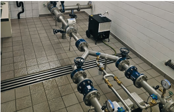
Von der Pumpe zum Leitungsnetz

Auch diese Pumpe schaltet sich ab einer bestimmten Marke automatisch ein und aus. Eine Besonderheit ist die sogenannte Löschreserve. Ein Teil des Wassers steht speziell für den Einsatz der Feuerwehr bereit. So ist die Wasserversorgung bei einem Ernstfall gesichert, unabhängig vom restlichen Wasserstand. Die Feuerwehr hat über die Auslösung der Löschreserve jederzeit Zugriff darauf.