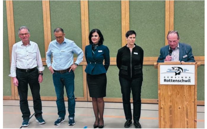
Der Gemeinderat Rottenschwil

Am 27. März 2026 lud der Gemeinderat zum 5. Mal zum Frühlingsapéro ein. Das Wetter zeigte sich eher winterlich, aber der schön geschmückte Saal mit frischen Blumen liess Frühlingsgefühle aufkommen. Rund 70 Personen sind der Einladung gefolgt und genossen gemeinsam einen geselligen Abend.