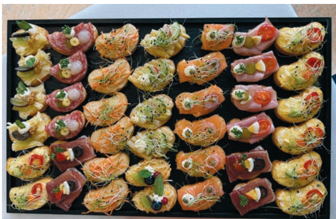
Kleine Häppchen zum Verzehr

Die Generalversammlung des Kapellenvereins fand am 19. März 2026 im Mehrzweckraum der Schule statt. Zehn Mitglieder nahmen daran teil. Die üblichen Traktanden wurden einstimmig angenommen und die Jahresrechnung konnte erfreulicherweise einen Gewinn ausweisen. Auch die Anpassungen der Vereinsstatuten wurden von den Mitgliedern gutgeheissen.