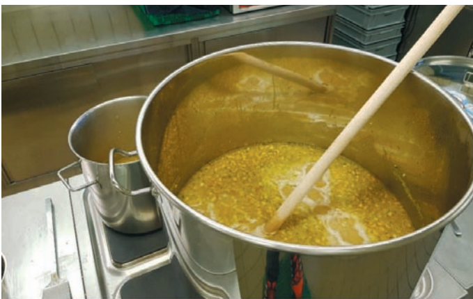
Gerstensuppe für den Frühlingsapéro

Zuvor kochten wir noch für die Gemeinde am Frühlings - Apéro. Es gab eine Bündner - Gersensuppe.