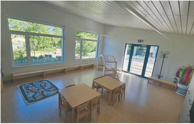
Die Einrichtung des Anbaus

nügten den Anforderungen nicht mehr. Im November 2025 wurde mit den Arbeiten begonnen und in Windeseile stand der Rohbau.