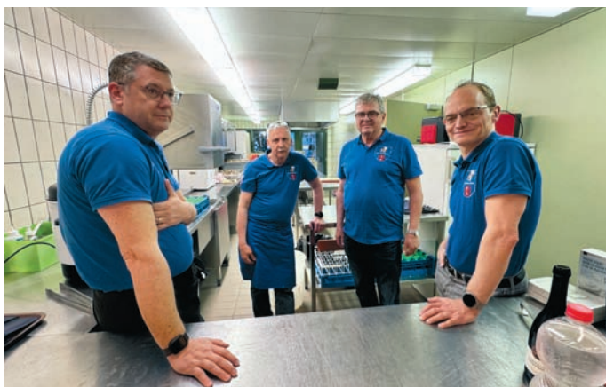
Die Kellerämter Chuchi im Einsatz

Der Gemeinderat dankt herzlich allen Helferinnen und Helfern, die zum reibungslosen Ablauf beigetragen haben, sei es bei der Vorbereitung, in der Küche, am Buffet, oder beim Dekorieren.