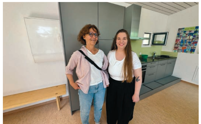
Die bisherige und die künftige Schulleiterin am Einweihungsfest

An der Gemeindeversammlung im Juni 2025 stimmte die Bevölkerung einem Kredit für die Erweiterung des Kindergartens zu.