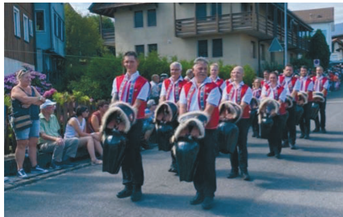
Trychler-Gruppe am Eidg. Scheller- & Trychlertreffen in Menzingen

Wir freuen uns sehr auf diese zwei Tage.