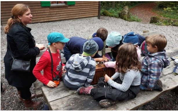
Kinder auf der Schatzsuche

Am 21. Oktober 2019 machten sich rund 20 Kinder auf die Schatzsuche. Knifflige Suchaufgaben führten zu einer Schatzkarte, die der Pirat Nebel-tuk im Jahre 1281 versteckt hat. Zum Glück war die Karte noch gut lesbar und wir konnten erkennen, wo der Schatz vergraben war. Mit vereinten Kräften wurde die verkettete Schatztruhe gefunden. Etwas mehr Aufwand haben wir gebraucht, um die passenden Schlüssel im Wald zu finden. Als das letzte Schloss aufgemacht wurde, haben sich die Schatzsucher den Schatz, wie es sich gehört, aufgeteilt. Zwischenverpflegung, Spiele, Lagerfeuer und die ausgelassene Stimmung der Kinder machten den Tag zu einem abenteuerlichen Erlebnis für alle.