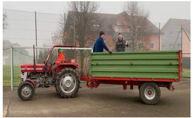
Der VMC ist bereit für die Papiersammlung

Mitte Februar, an einem nebligen aber trockenen Samstagmorgen, war es wieder einmal soweit. Die Vereinsmitglieder des Velo-Moto-Club Rottenschwil-Werd nahmen bereits zum 17. Mal die Herausforderung an. Der Auftrag lautete, die Bewohner unseres Dorfes von ihren angesammelten Papier- und Kartonbergen zu befreien. Mit dem Einsatz mehrerer Traktoren, Anhängern und sogar mit einem von Hand gezogenen Leiterwagen wurde das Altpapier im ganzen Dorf eingesammelt. Es ist immer wieder eine Freude, mit welchem persönlichen Engagement und großem Teamgeist jedes einzelne Vereinsmitglieder mit-hilft.