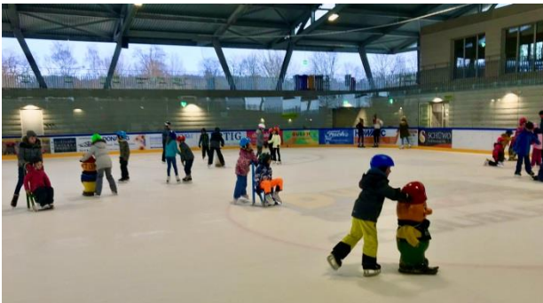
Spiel und Spass auf der Eisbahn

Die Sportferien boten allen eine kurze Verschnaufpause, um danach mit vollem Elan und Begeisterung dem ersten Ausflug beizuwohnen. Dieser führte uns nach Wohlen auf die Eisbahn. Alle genossen das Fahren auf den scharfen Kufen mit oder ohne tierischer und menschlicher Hilfe. Einzelne Schülerinnen und Schüler übten sich als Topscorer im Eishockey. Der Spass bei allen war gross und die Müdigkeit bei den jüngsten Schülerinnen und Schülern war noch grösser, sodass die Kleinsten die Heimfahrt im Bus friedlich am Fenster angelehnt verschliefen.