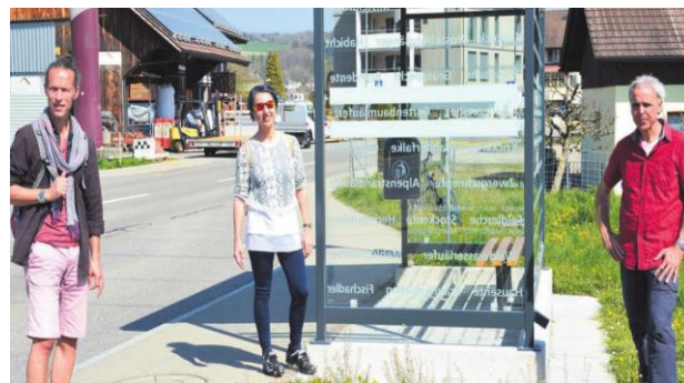
Neue Beschriftung am Personenunterstand Seematten

Rund einhundert Namen von hier einheimischen Piepmätzen wurden auf die Glasabdeckungen des Wartehäuschens in der Seematten mit weisser Folie geklebt. Ein QR-Code und der Spruch «Weitere Informationen unter www.stiftung-reusstal.ch/oar/vogelarten » wollen das Interesse wecken, sich mit den Tieren vertieft auseinanderzusetzen.