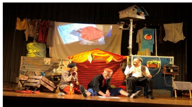
Theaterstück „Dä Ander wo Andersch“

Das Weihnachtsgeschenk an unsere Schule darf hier nicht vergessen gehen. „Dä Ander wo Andersch“ ein lustiges, aber auch zum Nachdenken anregendes Kinder-Theaterstück vom Theater Dampf, welches vom Fremden, vom Anderssein und von der Migration erzählt, war ein weiterer Lichtpunkt in der Adventszeit.