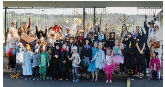
Réunion in der Schule Rottenschwil

und die Technik hatten ebenso unsere Schüler im Griff. Was bleibt? Eine tolle Erinnerung und die Vorfreude auf das närrische Treiben vom kommenden Jahr.