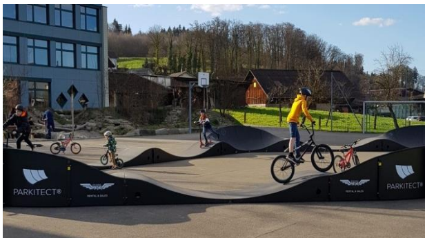
Action auf dem Pumptrack

Gerade bevor die Nachricht kam, dass alle Menschen zuhause bleiben sollen, stand den Rottenschwiler Jugendlichen während drei Wochen nochmal etwas Aussergewöhnliches zur Verfügung. Gemeinsam mit ihnen stellte die Jugendarbeit Kelleramt den mobilen Pumptrack des Kantons Aargau auf dem Schulareal auf. Schon während dem Aufbau waren die Kinder und Jugendlichen kribbelig und konnten sich kaum zurückhalten.