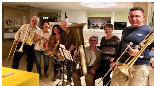
Mitglieder der Pressband