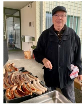
Die Bratwürste sind bereit.

Nach beendeter Sammlung bleibt stets genug Zeit, um sich gemeinsam mit einer goldbraun gebratenen Bratwurst, frisch zubereiteten Salaten