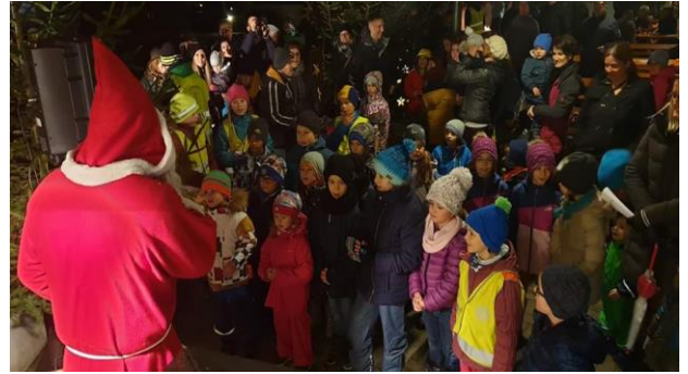
Strahlende Kinderaugen am Chlauseinzug

Seit der letzten Rotti-Poscht haben wir zusammen mit den Trychlern den Chlauseinzug organisiert. Es war ein gelungener Anlass für Gross und Klein! Viele leuchtende Kinderaugen und zufriedene Eltern, sind unser Antrieb für die nächsten Anlässe.