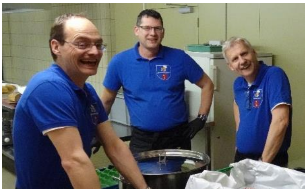
Kochteam der Kellerämter Chuchi

Die drei Rottenschwiler der Kellerämter Chuchi verwöhnten die Behörden und die Bevölkerung anlässlich des Neujahrsapéros der Gemeinde mit einer Bündner Gerstensuppe.