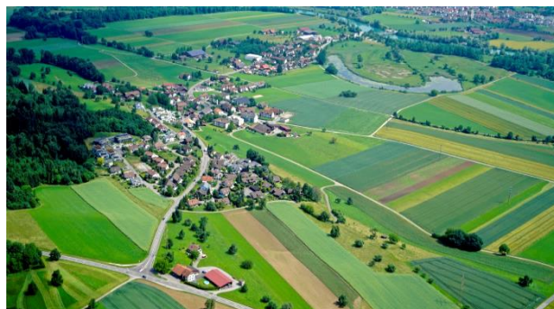
Luftbild Rottenschwil 2018