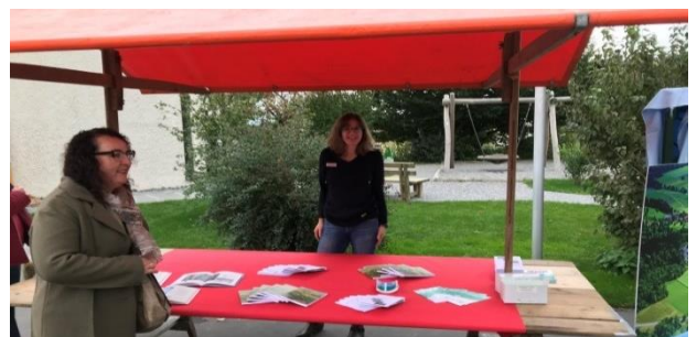
Auch die Gemeinde Rottenschwil betrieb einen Marktstand mit Informationen über die Gemeinde.

Die Gemeinde Rottenschwil hat am 17. Oktober 2020 erstmals zum Herbstanlass eingeladen. Am Nachmittag konnte bei neun Marktständen Kunsthandwerk von Nah und Fern, Flohmarktartikel, Bauernhoflebensmittel, Magenbrot und weitere Süßigkeiten sowie Wachstücher erworben werden.