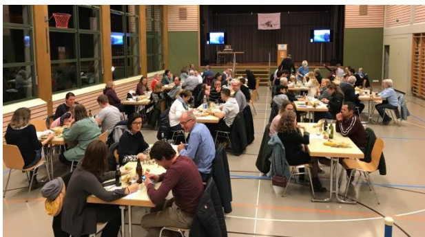
Die Gäste wurden kulinarisch verwöhnt durch den Kulturverein Rottenschwil.