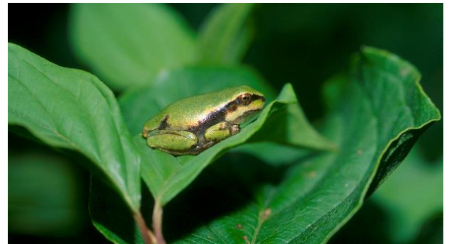
Juvenile, ein gut getarnter Laubfrosch auf einem Blatt

Welche Überraschung! Die Laubfrösche im Freilandterrarium auf dem Areal des Zieglerhauses haben Nachwuchs bekommen! Wer genau hinschaute, konnte auf den Blättern die gut getarnten, kleinen, grünen Frösche erkennen. Mindestens zehn Jungtiere waren es! Niklaus Peyer, Biologe und Mitarbeiter der Stiftung Reusstal, holte einige Jungtiere raus, um Dichtestress zu vermeiden, und entliess sie im Rottenschwiler Moos in die Freiheit.