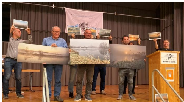
Die ersten zehn platzierten Fotos des Fotos-Wettbewerbs „Rottenschwil und der Nebel“.

Der Herbstanlass hat gezeigt, dass die Leute zusammenkommen wollen. Vorsicht muss sein. Aber es darf nicht sein, dass alle Veranstaltungen verschoben oder gar abgesagt werden. Solidarität in Krisenzeiten kann sich auch zeigen, indem jemand etwas für andere organisiert und somit Ablenkung schafft. Herzlichen Dank allen die mitgeholfen haben bei dieser Premiere.