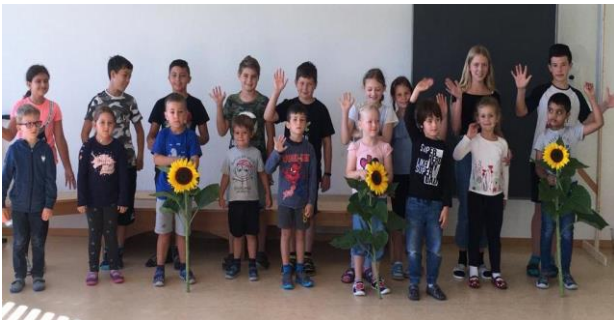
Begrüssung der neuen Schülerinnen und Schüler.

Nach den Sommerferien dann starteten wir etwas entspannter, aber dennoch mit den weiterhin geltenden Ausnahmeregeln in das neue Schuljahr. Die neuen Schülerinnen und Schüler wurden mit einer Sonnenblume begrüsst und herzlich aufgenommen.