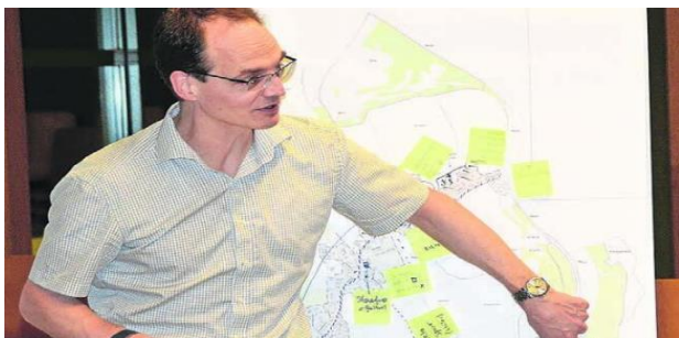
Die Ergebnisse wurde von den Gruppen vorgestellt.