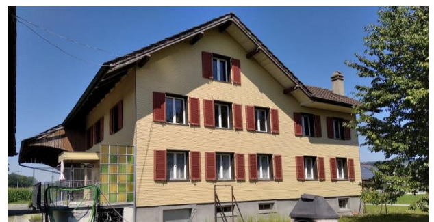
Der neue Standort des Vereins Huus 14.

Das Ferienangebot, das 2018 gegründet wurde, erfreut sich grosser Beliebtheit. Wir freuen uns, dass wir wachsen dürfen und dies an einer neuen Adresse. Im März 2021 ist eine Neueröffnung an der Hauptstr. 13 geplant. Am neuen Standort bieten wir 5 Gästezimmer an. An dieser Stelle ein grosses Dankeschön an die Familie Hoppler! Ihr habt es möglich gemacht.