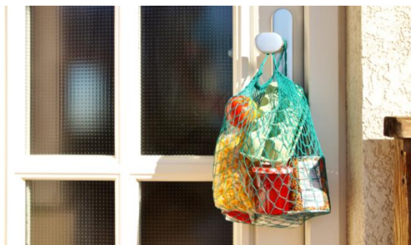
Die Nachbarschaftshilfe funktionierte prächtig.

Wir freuten uns sehr über die grosse Nachbarschaftshilfe. Nachbarn und Jugendliche kauften für die Leute der Risikogruppen ein und führten auch andere Botengänge aus. Das war grossartig! Die gegenseitige Unterstützung funktionierte bestens, ein starkes Zeichen für die Nächstenliebe.