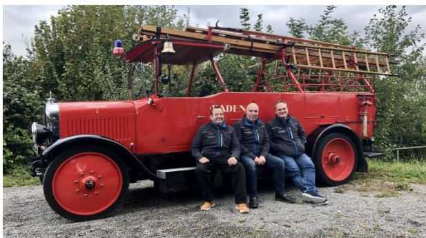
Die abtretenden Kameraden.

Wir bedanken uns an dieser Stelle herzlich für den geleisteten Einsatz über all die Jahre und wünschen ihnen alles Gute auf dem weiteren Lebensweg.