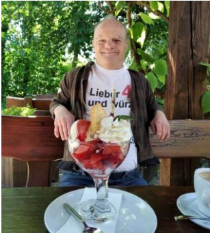
Eiscreme zaubert ein Lächeln auf jedes Gesicht.