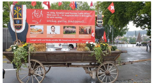
Das OK-Team organisierte einen mini Umzug am eigentlichen Eröffnungstag der 14. Eidg. Scheller und Trychler Treffens.

Auch die Generalversammlung des Trägervereins „Trychlerfründe Freiamt“, bestehend aus der Trychler-Gruppe Rottenschwil und den Trychler und Chlaus aus Buttwil, musste verschoben werden. Diese konnte am Freitag 28. August auf dem Areal von Stadelmann Zelte in Bremgarten abgehalten werden. Solidarisch zu dem verschobenen Eidg. Scheller und Trychler treffen, welches an diesem Tag eröffnet worden wäre, organisierte das OK-Team einen „mini Umzug“ vom Bremgartener Obertor durch die Altstadt bis zum Casino. Mit einem kleinen Apéro vorab trafen die Trychlergruppen mit dem OK zusammen und liessen so die Vorfriede wieder aufleben. Einige Zuschauer und Passanten in der Altstadt zeigten wahre Freude und Begeisterung, welche uns weitem Mut und Zuversicht für 2021 gibt.