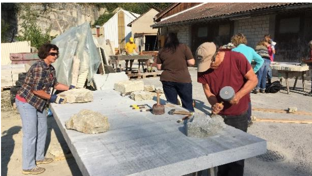
Vogelbad meisseln im Steinbruch der Emil Fischer AG in Hendschiken; Foto von Sarah Wettstein, Stiftung Reusstal

Wer so richtig Hand anlegen wollte und gerne Vögel im eigenen Garten beobachtet, konnte am 12. September 2020 an der Naturwerkstatt Vogelbad im Steinbruch Emil Fischer AG in Hendschiken teilnehmen und aus einem Block Mägenwiler Muschelkalk sein eigenes Vogelbad meisseln. Zu Beginn führte Herr Egger, Steinmetz von der Emil Fischer AG, auf einem kleinen Rundgang durch den Steinbruch und erklärte anschaulich die Entstehung der Gesteine. Danach erklärte er die Handhabung der Werkzeuge und dann ging es los ans Meisseln. Verschwitzt und staubig, aber sichtlich stolz und zufrieden präsentierten die Teilnehmer am Abend ihre Vogelbäder.