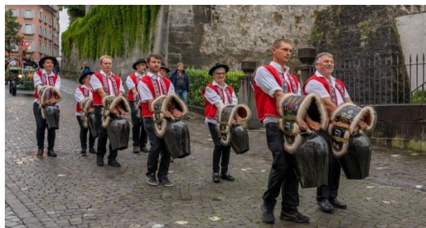
Mitglieder der Trychler-Gruppe Rottenschwil.

Auch wir von der Trychler-Gruppe Rottenschwil mussten uns der Covid 19 Pandemie stellen und unsere Vereinsaktivitäten einstellen. Diverse Veranstaltungen für die wir gebucht waren wurden abgesagt. Selbst an vereinsinterne Anlässe war nicht mehr zu denken. So mussten wir zwei neue Interessierte (Mitglieder) bis auf weiteres vertrösten, bis ein erster Trainingsabend abgehalten werden konnte. Dieser fand dann nach langem Abwarten am 23. Juli bei der Waldhütte statt. Das erste Zusammentreffen seit dem Corona Lockdown. Selbst ich hatte das Gefühl die Trychler müsste erst neu gestimmt werden, war diese doch seit dem letzten Einsatz im Dezember verstummt geblieben.