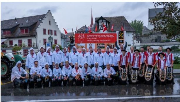
Das 14. Eidg. Scheller und Trychler Treffen musste leider verschoben werden.

Auch die Generalversammlung des Trägervereins „Trychlerfründe Freiamt“, bestehend aus der Trychler-Gruppe Rottenschwil und den Trychler und Chlaus aus Buttwil, musste verschoben werden. Diese konnte am Freitag 28. August auf dem Areal von Stadelmann Zelte in Bremgarten abgehalten werden. Solidarisch zu dem verschobenen Eidg. Scheller und Trychler treffen, welches an diesem Tag eröffnet worden wäre, organisierte das OK-Team einen „mini Umzug“ vom Bremgartener Obertor durch die Altstadt bis zum Casino. Mit einem kleinen Apéro vorab trafen die Trychlergruppen mit dem OK zusammen und liessen so die Vorfriede wieder aufleben. Einige Zuschauer und Passanten in der Altstadt zeigten wahre Freude und Begeisterung, welche uns weitem Mut und Zuversicht für 2021 gibt.