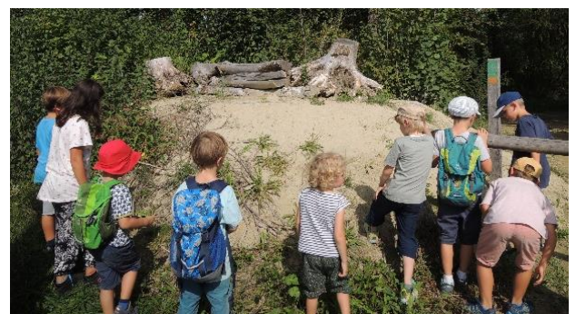
Kinder suchen einen Sandhügel nach Reptilien ab

Seit August 2020 kehrt jedoch die Normalität stückweise zurück, indem wieder Exkursionen angeboten und gebucht werden. Am 5. September 2020 fand die beliebte Familienexkursion «Schlangenhaut und Echseneier» statt. Die Kinder schlüpfen in die Rolle von Reptilien und erfuhren hautnah, wie und was Reptilien fressen, welche Feinde sie haben und warum sie sonnenbaden müssen.