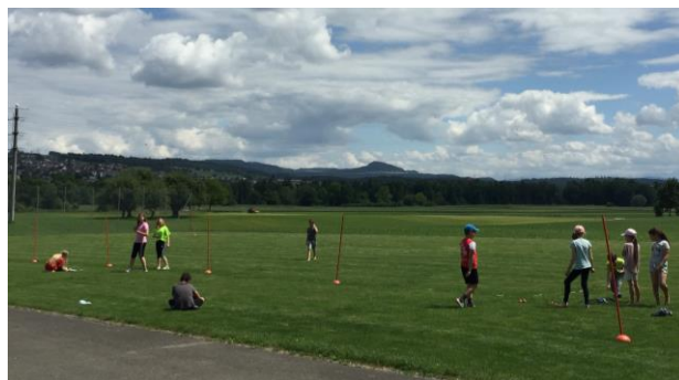
Der schulinterne Sporttag durfte auch in diesem Schuljahr nicht fehlen.

Nichts desto trotz fand in einer abgespeckten Form unser schulinterner Sporttag statt, der viel Spass bereitet hat. Wir konnten uns in den Disziplinen Hochsprung, Weitwurf, Weitsprung und Dauerlauf messen. Die Schülerinnen und Schüler der Mittelstufe haben das Vorbereiten der Anlagen und das Messen der Ergebnisse übernommen.