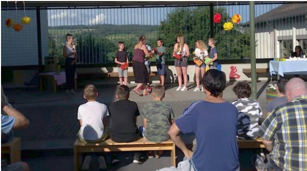
Die Schulschlussfeier fand im kleinen Rahmen statt.

Die Schulschlussfeier feierten wir in den Klassen, ebenfalls im kleinen Rahmen. Einzig die Sechstklässler durften eine kleine Abschlussfeier auf dem Schulhausplatz halten und wurden im Beisein ihrer Mitschüler und ihren Eltern von ihren Lehrerinnen verabschiedet. Es war eine kleine, aber sehr stimmungsvolle Feier.