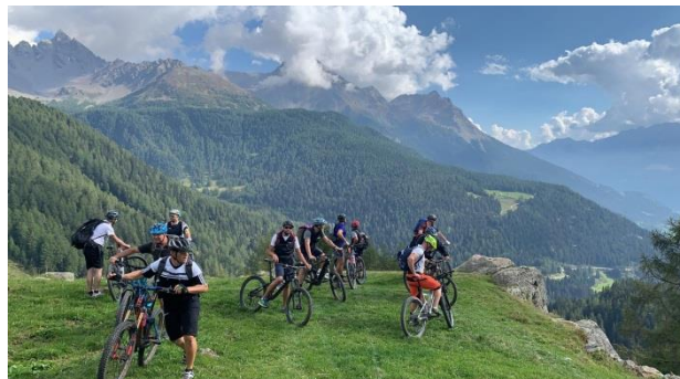
Eine Biketour mit atemberaubender Aussicht.

mal eine grossartige Vereinsreise. Vielen Dank Markus für die Organisation und dem Busfahrer Marco, der uns am Sonntagabend durch den stockenden Verkehr wieder sicher nach Rottenschwil brachte.