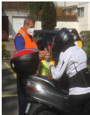
Die Schüler im Einsatz mit der Regionalpolizei.

Schon bald kam die Regionalpolizei zu Besuch. Die Besucher führten unsere Schülerinnen und Schüler