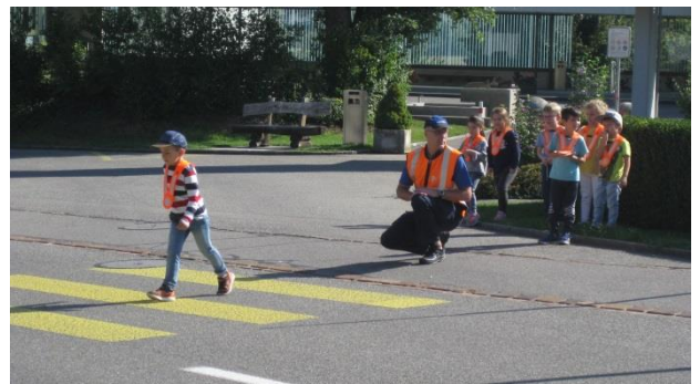
Verkehrsunterricht mit der Polizei.

Kurz darauf kam ein weiterer Polizist zu Besuch. Diesmal wurden die Kindergärtner im Verkehrsunterricht geschult, damit sie richtig über die Strasse gehen.