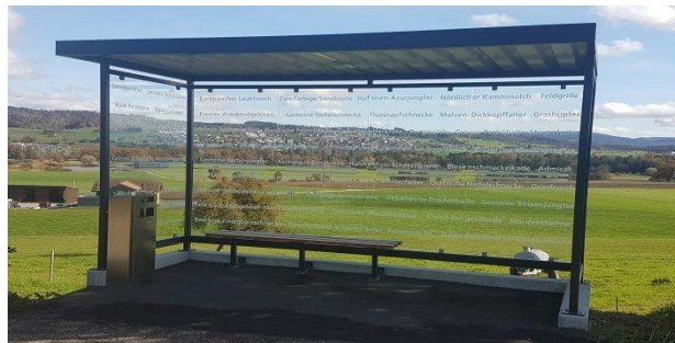
Der Personenunterstand Rebberg ist nun für Vögel sicher.

Im Frühling 2020 hat die Gemeinde Rottenschwil gemeinsam mit der Stiftung Reusstal den Vogelschutz beim Personenunterstand Seematten realisiert. Auch der Vogelschutz bei den anderen beiden Personenunterständen wurde nun ganz nach dem Motto «Rottenschwil wo die Natur zuhause ist» umgesetzt. Dabei wurde an das bestehende Konzept angeknüpft.