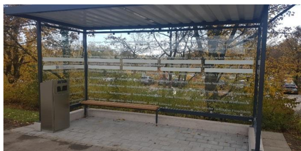
Neue Beschriftung am Personenunterstand Hecht.

Der Personenunterstand im Rebberg, welcher bereits seit zwei Jahren besteht, wurde mit rund einhundert Namen der heimischen Fauna beschriftet. Ein QR-Code und der Spruch «Weitere Informationen unter www.stiftung-reusstal.ch/natur-landschaft/biodiversitaet/fauna » wecken das Interesse, sich mit der Tierwelt vertieft auseinanderzusetzen.