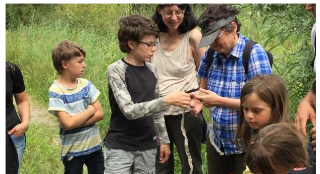
Kinder berühren eine echte Schlangenhaut; Foto von Sarah Wettstein, Stiftung Reusstal.

Auf zwei ganz unterschiedliche Weisen bekamen wir von der Stiftung Reusstal die Pandemie zu spüren. Auf der einen Seite mussten wir unser Veranstaltungsprogramm mit den öffentlichen Anlässen und Exkursionen in der ersten Jahreshälfte rigoros zusammenstreichen. Gebuchte Exkursionen wurden abgesagt und Anfragen erfolgten keine mehr. Auf der anderen Seite nutzten viele Erholungssuchende ihre neu gewonnene Freizeit und waren zu Fuss, mit dem Velo, mit dem Boot oder dem Wohnmobil im Reusstal unterwegs. Die Gruppe Information und Aufsicht der Stiftung Reusstal hatte alle Hände voll zu tun, um die Leute über die Naturwerte aufzuklären und auf Verstösse aufmerksam zu machen. Dies erforderte zusätzliche Einsätze und einen intensivierten Pikettendienst der Ranger.