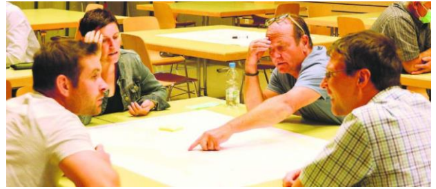
Die Workshop-Teilnehmenden diskutierten verschiedene Zukunftsszenarien für Rottenschwil.

sehr hoch. Die Natur lade zum Spazieren und Sinnieren ein.