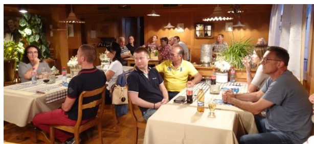
Interessierte Teilnehmerinnen und Teilnehmer.

Das Raumplanungsgesetz des Bundes und das Baugesetz sowie die Bauverordnung des Kantons Aargau regeln die Baubewilligungspflicht. Beim Begriff Bauten und Anlagen handelt es sich dabei vor allem um fest mit dem Boden verankerte Bauwerke, Strassen, Parkplätze aber auch um Gruben, Terrainveränderungen und Freizeitanlagen. In der Bauverordnung § 49 und § 49a werden baubewilligungsfreie Anlagen und Bauten deklariert. Dabei handelt es sich insbesondere um Kleinstbauten, Zäune, temporäre Bauten, Garten- und Aussenraumgestaltungen, Wahlplakate und Solaranlagen. Die weiteren gesetzlichen Normen wie z. B. die Grenzabstände müssen trotzdem eingehalten werden. Spätere Nutzungsänderungen unterliegen ebenfalls der Baubewilligungspflicht, sofern öffentliche oder nachbarschaftliche Interessen betroffen sind.