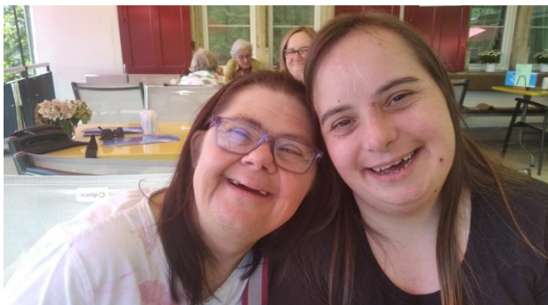
Neue Gäste im Huus 14.

Bereits anfangs März, die Farbe an den Wänden ist erst gerade getrocknet, dürfen wir die ersten Gäste begrüßen. Wir sind froh und stolz, dass wir unser Projekt und unser Traum an einem so schönen Ort in die Zukunft führen können.