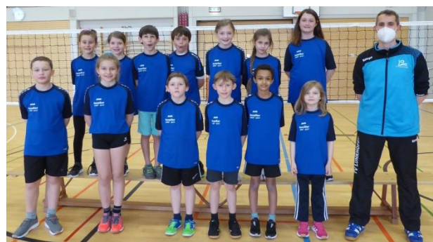
Teamfoto Lunki Minis

Volleyball ist eine technisch hoch anspruchsvolle Sportart. Deswegen versuchen wir Jugendliche sehr früh für unseren Sport zu begeistern und ihnen die Grundlagen bereits in jungen Jahren beizubringen. Wir beginnen bei den Jüngsten mit dem klassischen «Ball- über- die Schnur», da es die meisten Kinder kennen und reichern das Spiel dann mit immer mehr Volleyballelementen an. Die Minis sind Jungs und Mädchen ab der 2. Klasse. Obwohl unsere Minis bereits seit letztem Jahr trainieren, wird und soll das Rottenschwiler Minitraining für Anfänger geeignet sein. Schnupperlinge sind also jederzeit willkommen.