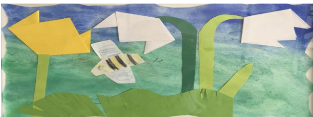
Einige Bilder der Ausstellung „Frühlings-erwachen“.