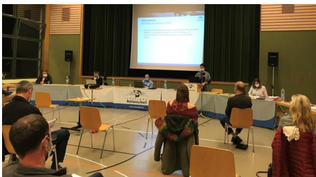
Die Gemeindeversammlung fand unter Einhaltung strenger Schutzmassnahmen statt.

Die Winter-Gemeindeversammlung fand unter Einhaltung von strengen Schutzmassnahmen statt. 27 Stimmberechtigte (rund 4 % Stimmbeteiligung) nahmen an der Gemeindeversammlung teil. Neben den üblichen Traktanden wie der Protokoll- und Budgetgenehmigung hatten die Stimmberechtigten über die Jahresrechnung, eine Kreditabrechnung, einen Verpflichtungskredit für die Sanierung der Werdstrasse/Hausmatten sowie einen Verpflichtungskredit für die Erstellung einer Schlammwässerungsanlage auf der ARA Kelleramt in Unterlunkhofen, das neue Abfallreglement, das neue Personalreglement sowie die Zusicherung des Gemeindebürgerrechts an Schick Carl abzustimmen.