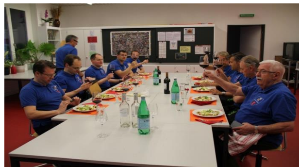
Das Vergnügen nach getaner Arbeit.

Leider durften auch wir nicht gemeinsam kochen, umso mehr freuen wir uns eventuell ab Oktober unser gemeinsames Hobby kochen auszuüben.