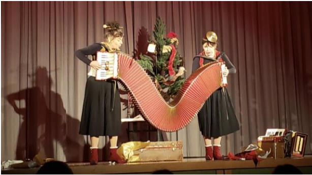
Das Theater kam bei allen gut an.

Lehrpersonen schätzten diese Vorstellung und genossen den Unterbruch des Alltages sehr.