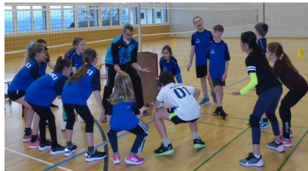
Im Training wird fleissig geübt.

Damit wir Trainingsinhalte vertiefen können und um den Kindern mehr Zeit zu geben, Neues in Spielformen auszuprobieren, brauchen wir ein zweites Training.