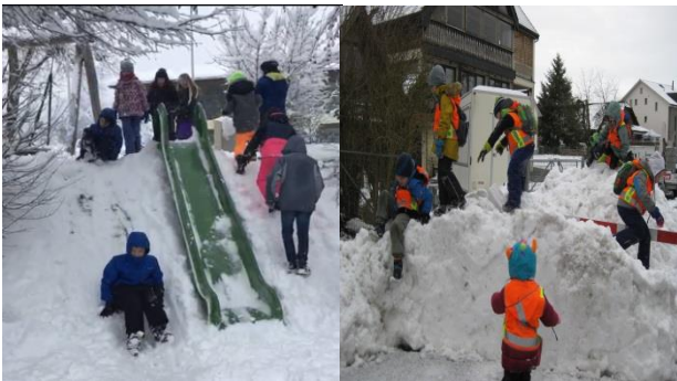
Die grossen Schneemengen wurden rege für Spiel und Spass genutzt.

Plötzlich kam der Winter. Rottenschwil wurde mit einem Schneezucker überpudert, was alle ins Freie lockte und einige Schneemänner und Schneeballschlachten rund ums Schulhaus bescherte. Eine schöne Abwechslung!