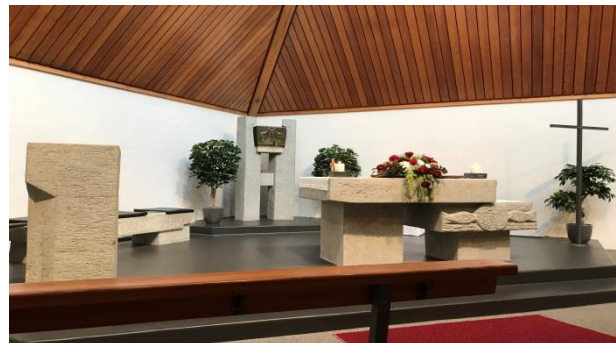
Ein Blick in die Kapelle in Rottenschwil.

Die diesjährige GV des Kapellenvereins konnte leider nicht durchgeführt werden.