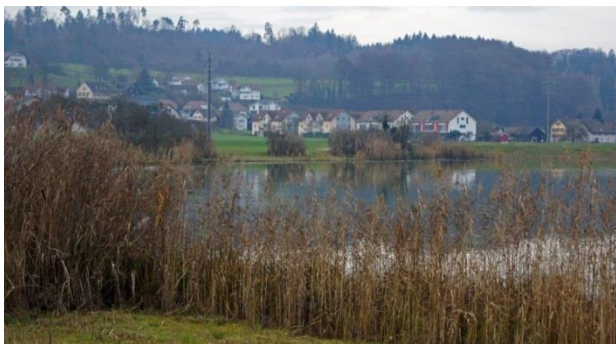
Das Räumliche Entwicklungsleitbild leistet eine Gesamtschau über das Gemeindegebiet.

Die daraus gewonnenen Erkenntnisse hat die Planungskommission soweit möglich in der Erarbeitung der Entwürfe des Räumlichen Entwicklungsleitbildes sowie des Kommunalen Gesamtplans Verkehr miteinfließen lassen.