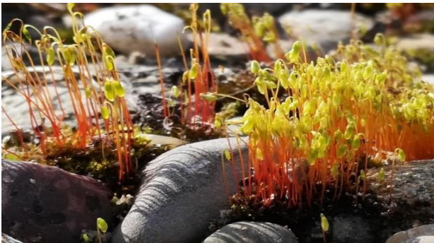
Das vom Aussterben bedrohte Bunte Birnmoos ( Bryum versicolor ) kommt in der Reusebene noch an ausserwählten Standorten vor.

Die Moose besiedeln seit 490 Millionen Jahren die Erde und sind die einzigen Pflanzen, die eine Austrocknung unbeschadet überstehen. Sie sind perfekt an ihren jeweiligen Lebensraum angepasst und weisen eine unglaubliche Vielfalt auf. Thomas Kiebacher wusste zu jeder vorgestellten Moos-Art eine Geschichte zu erzählen und begeisterte die Teilnehmenden mit persönlichen Anekdoten. So sieht zum Beispiel das an feuchten Stellen wachsende Bäumchenmoos ( Climacium dendroides ) wie ein Miniaturbäumchen aus, weshalb man es sich gut merken kann. Das Torfmoos ( Sphagnum sp.) kann das bis zu 36-fache seines Eigengewichts an Wasser speichern. Es bildet die Grundsubstanz des Torfes in den Mooren weltweit und spielt eine wichtige Rolle bei der CO 2 -Fixierung auf unserer Erde. Es baut also Treibhausgase ab. Das Bunte Birnmoos ( Bryum versicolor ), nach welchem die Exkursion benannt war, ist eine vom Aussterben bedrohte Pionierart der Auengebiete und kommt in der Reusebene nur noch an wenigen Stellen vor. Dessen winzigen, hübschen Kapseln erinnern an Schneeglöckchen.