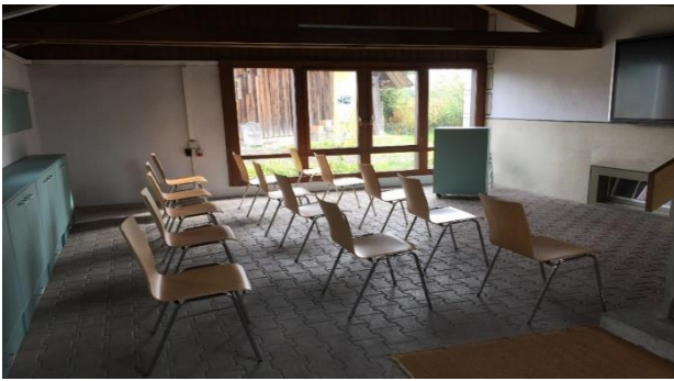
Der 2020 neu eingerichtete Vorraum im Zieglerhaus mit Sideboard, Rednerpult und grossem Bildschirm für Vorträge.