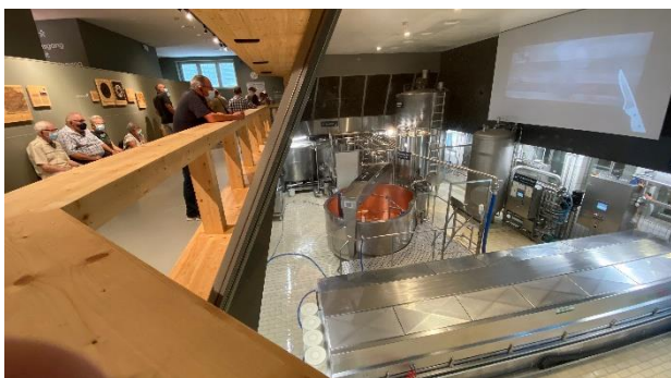
Interessante Führung in der Appenzeller Schaukäserei

Nach einer kurzen Weiterfahrt hofften einige Teilnehmende auf das Rezept für den Appenzeller Käse. Allerdings konnten auch die sympathischen Führerinnen das Geheimnis nicht lüften. Nichts desto trotz schmeckte der Käse bei der Degustation und dem anschliessenden Apéro sehr gut.