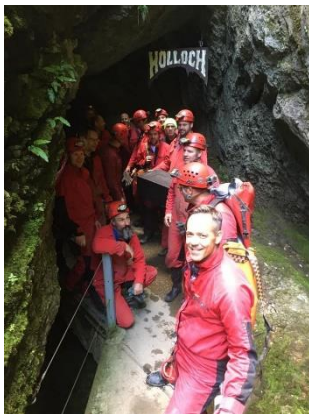
Ein Abstecher ins Höllloch

Es war wieder zu Beginn September, wir alle erwarteten sehlichst die TV-Reise. Am Wochenende des 11. und 12. Septembers war es dann so weit. Die wie gewohnt abwechslungs- und erlebnisreich gestaltete Reise führte uns zunächst mit Bus und Zug ins Muotathal.