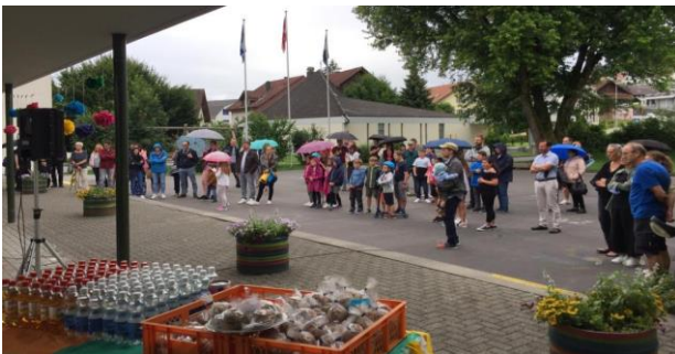
Vernissage und Schulschlussfeier in einem

Eine Vernissage zum Ende des Kunstprojektes am 30. Juni war zugleich auch die Schulschlussfeier. Bei schönem Wetter und mit allseits gut gelaunten Eltern durften die Objekte im Dorf, im Schulhaus und in der Turnhalle bestaunt werden. Im Anschluss an die Vernissage wurden die Sechstklässler verabschiedet.