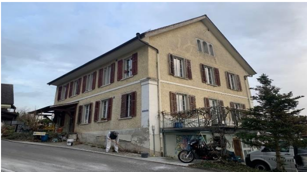
Das Alte Schulhaus vor der Renovation

Auch wenn heute dort nicht mehr Bleistifte gespitzt werden.