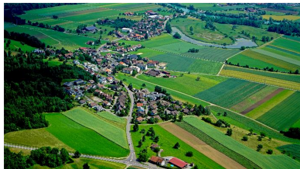
Ausgestelltes Luftbild aus dem Jahr 2018

Wie stellte sich der Gemeinderat das Dorf im Jahr 2028 vor? Lösung: attraktiv, aktiv und lebendig