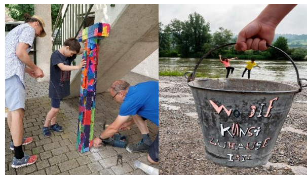
Kunstwerke zum Thema «Gross-Klein»

Ab Mai wurden die wöchentlichen Projektstunden für ein stufenübergreifendes Kunstprojekt mit dem Thema «Gross-Klein» genutzt. Die anschliessende Projektwoche im Juni beschäftigte die Kinder, die Lehrerinnen und das technische Schulpersonal für eine Woche intensiv.