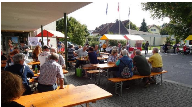
Bei sommerlichem Wetter zog es die Einwohnerinnen und Einwohner nach Draussen auf den Schulhausplatz

Ende September 2021 liess der Altweibersommer die Temperaturen nochmals in die Höhe steigen. Sodass am Herbstmarkt sommerliches Wetter herrschte. Neben den verschiedenen Marktartikeln, welche bei den rund zehn Marktständen erworben werden konnten, waren auch die Spielecke und die Festwirtschaft sehr beliebt.