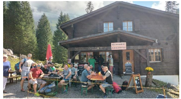
Verpflegung und Pause

Waldisee. Nach dem geselligen Aufenthalt und Mittagessen orientierten wir uns wieder Talwärts, um langsam die Heimreise anzutreten.