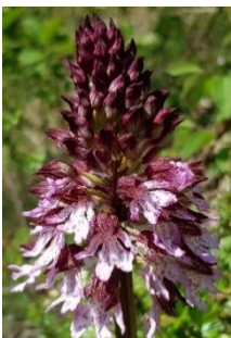
Purpur-Knabenkraut: Foto: Josef Fischer