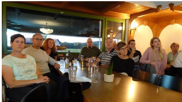
Die Teilnehmer waren an der Vorstellung des Kreisel-Projektes sehr interessiert

die Polizei aufgeboten wurde, es gab bestimmt einige mehr, bei denen es nur Blechschaden gab.»