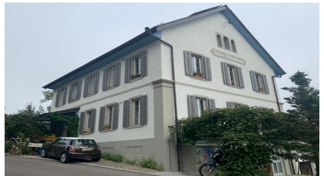
Das fertiggestellte Gebäude

Viele positive Rückmeldungen konnten wir für unsere Arbeit entgegennehmen. Das erfüllt uns mit Stolz.