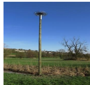
Die im April 2021 errichtete Telefonstange mit aufgesetzter Plattform wurde von den Weissstörchen gerne als Nistmöglichkeit angenommen.

Diesen Frühling wollte in Unterlunkhofen auf einem Mast der Freileitung ein zweites Weissstorch-Paar auf einer Querstrebe einen Horst bauen. Einerseits wäre dieser Horst dem bereits bestehenden zu nah gekommen, was Stress für die Tiere bedeutet hätte. Andererseits besteht hier die Gefahr von Kurzschlüssen, was dann auch eintraf. Das Nest musste entfernt werden. Dank der guten Zusammenarbeit der Stiftung Reusstal mit dem AEW, dem Kanton und dem Landbesitzer konnte an der Alten Jonen auf einer eigens für diesen Zweck errichteten ausgedienten Telefonstange eine neue Horst-Plattform angeboten werden. Wie sich zeigte, nahm das Storch-Paar die neue Plattform schnell an und zog seine Jungen am Ersatzstandort gross. Dieser lag zwar nicht ganz so hoch, dafür sicher.