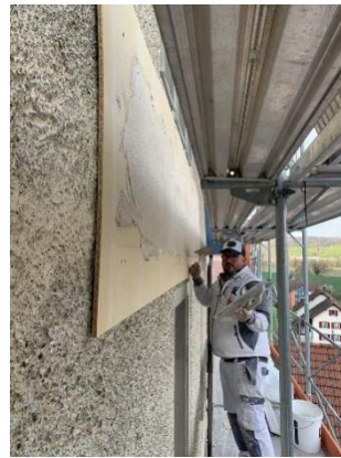
Entstehung des Spiegels