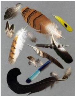
Farbenprächtige Vogelfedern.