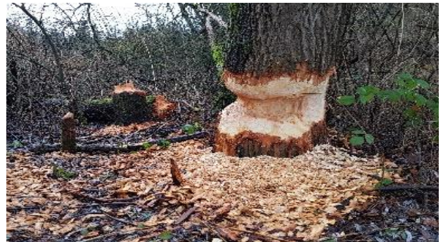
Biber-Nagespuren an einer mächtigen Weide.