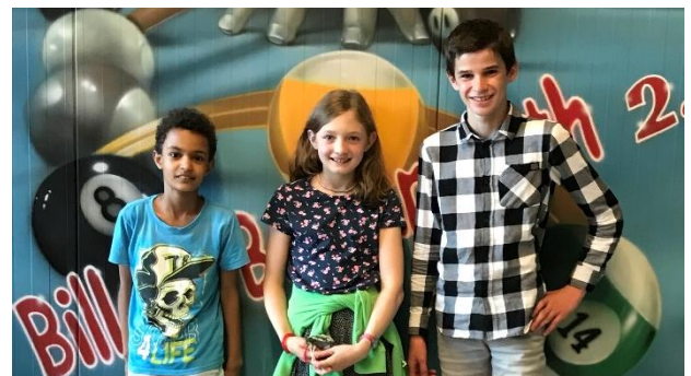
Drei der fünf Ministranten beim Bowling-Center