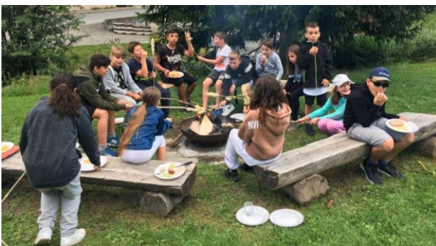
Grillieren am Lagerfeuer

Schon bald darauf startete das neue Schuljahr. Die neu zusammengestellte Mittelstufe fuhr alsbald in das Klassenlager, wo sie sich noch besser kennenlernten und zu einer eingeschworenen Klassengemeinschaft heranwachsen. Die Fahrt nach Tschier im Münstertal mit Wanderungen im Nationalpark, Klosterbesichtigung, Schwimmbadbesuchen, Lagerfeuer und einer rauschenden Abschlussparty wird allen unvergesslich bleiben.