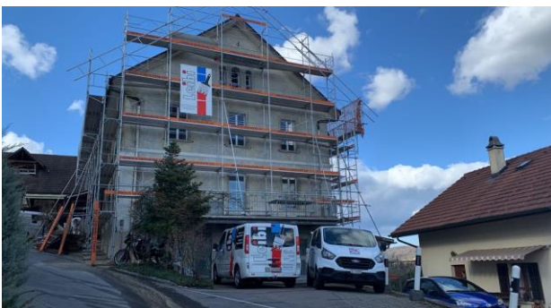
Während der Arbeiten

Nachdem das Konzept feststand konnten die Arbeiten beginnen. Leider hat das Wetter nicht immer mitgespielt weswegen sich der Zeitplan etwas verzögerte.