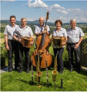
Die Kapelle Wasserflue.

letzten Jahren besucht er die Musikschule Zug, anfangs einen Lehrgang in Harmonielehre, seit ca. zwei Jahren einen Lehrgang in Kompositionslehre. So ist es naheliegend, dass in den letzten Jahren die ersten eigenen Kompositionen entstanden sind. Viel Zeit investiert er in das Arrangieren der von der Kapelle Wasserflue gespielten Titel. Zurzeit spielt er im Volksmusik Ensemble der Musikschulen Zug mit und in der von ihm gegründeten Kapelle Wasserflue.