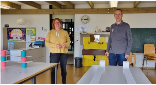
Die Türen des Vereins Tagesstrukturen standen offen.