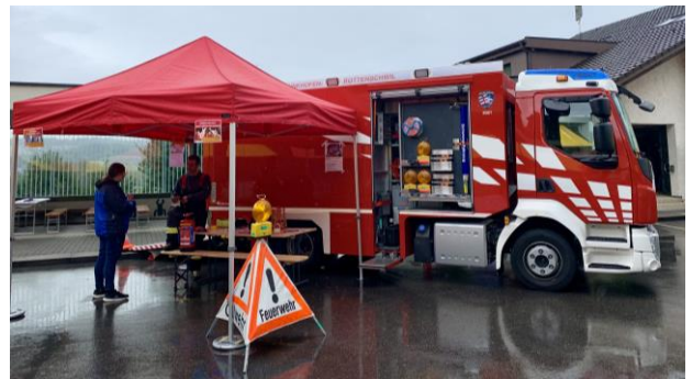
Die Feuerwehr präsentierte sich am Herbstmarkt in Rottenschwil.

Ebenso durften wir uns in Rottenschwil am Herbstmarkt mit einem Auftritt präsentieren.