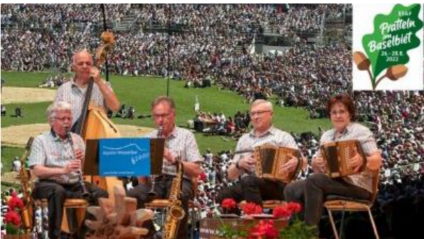
Auftritt in Pratteln am ESAF.

Mit der Kapelle Wasserflue konnte er schon div. Radio und TV Auftritte machen. In diesem September durfte die Kapelle im Vorprogramm des ESAF in Pratteln auftreten, aber auch Firmenfeste wie im Oktober 2022 im Tägi Wettingen gehören zu den Auftritten. In Wettingen übrigens das erste Mal mit einer Einlage mit dem Alphorn vor über 1000 Personen. Weitere Informationen finde Sie unter: www.kapelle-wasserflue.ch