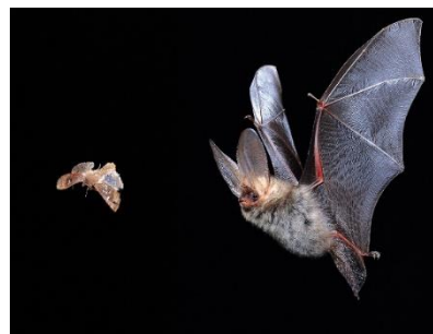
Eine Fledermaus auf der Jagd.