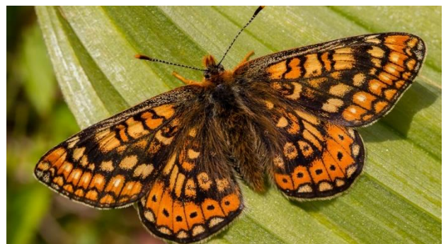
Der stark bedrohte Skabiosen-Schreckenfalter ist im Reusstal noch anzutreffen.