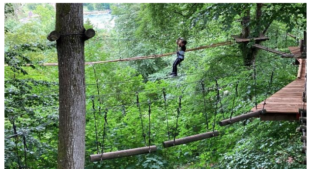
Ein toller Ausflug in den Kletterpark am Rheinfall.

Kurz darauf ging es in den Kletterpark am Rheinfall. Dort zeigten alle ihren Mut und ihr Geschick beim Klettern und Balancieren. Die grösste Freude hatten die meisten beim Hinuntersausen an den Seilbahnen, einige konnten einfach nicht genug davon bekommen!