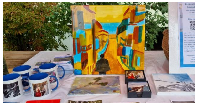
Auch die Kunst kam am Herbstmarkt nicht zu kurz.