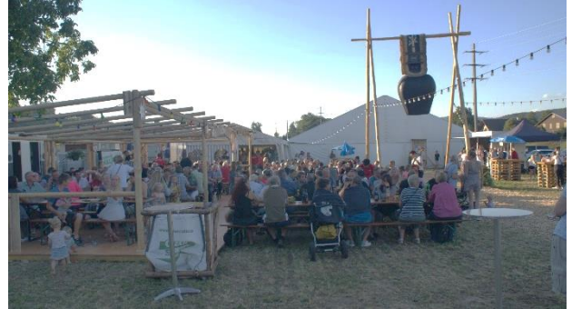
Der Festplatz wurde liebevoll gestaltet.

scheinung gelangte. Bereits 2 Wochen zuvor wurden an den Strassenkandelaber eigens angefertigte Trychlen (Glocken) aufgehängt, die bei Nacht leuchteten. Das ganze Festgelände war einladend gestaltet und mit der Festbeleuchtung ein Blickfang für jedes Auge. Dieser Aufwand wurde während den ganzen 3 Tagen immer wieder mit grossem Lob und Dank gerühmt.