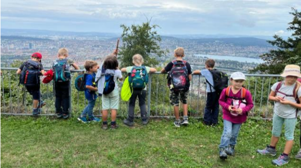
Die Unterstufe erklimm den Uetliberg.

Das neue Schuljahr begann mit Schwung und die Klassenreise führte die Unterstufe Anfang September auf den Üetliberg. Trotz des Regens war es ein schöner, spannender Ausflug. Die Kinder liebten das Busfahren und die steilen Wege und sie waren begeistert von der schönen Aussicht auf die Stadt Zürich.