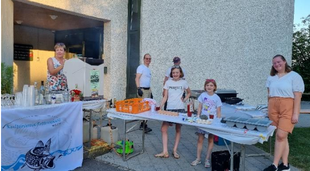
Das Helferteam vor dem Ansturm.

Am 31. Juli 2022 fand bei schönem und lauem Wetter die Bundesfeier auf dem Schulhausplatz statt. Alle Teilnehmenden erhielten einen Bon für eine Grillade mit Beilage. Die Bewirtung erfolgte wiederum durch den Kulturverein Rottenschwil. An dieser Stelle ein herzliches Dankeschön an die Helfenden auf dem Platz wie aber auch die fleissigen Kuchenbäcker/innen.