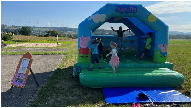
Das Highlight der Kinder war die Peppa Pig-Hüpfburg.