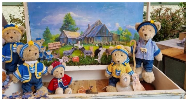
Der Bär Rotty des Bärenstüblis in Rottenschwil.