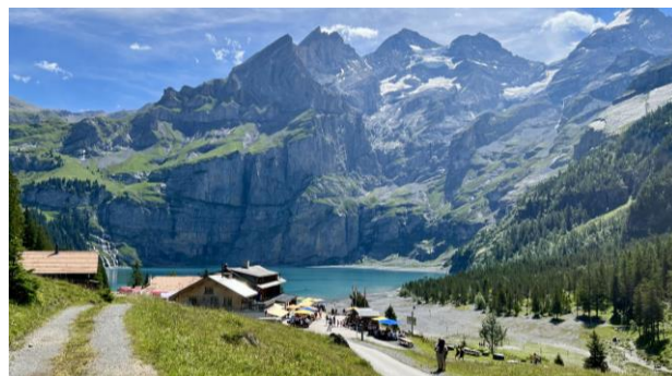
Ein toller Vereinsausflug zum Oeschinensee.

schönstem Sonnenschein hinauf in die Nähe des Oeschinensee. Von der Bergstation aus erreichten wir nach einem gemütlichen Spaziergang das Berghotel Oeschinensee. Für wen der Weg zu beschwerlich war, fuhr ein Shuttlebus von der Bergstation zum Oeschinensee.