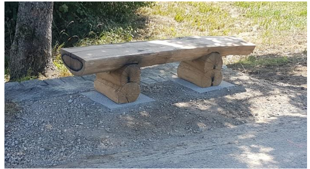
Auch im Bereich Oberaue Werdstrasse Richtung Stille Reuss wurde eine neue Bank platziert.