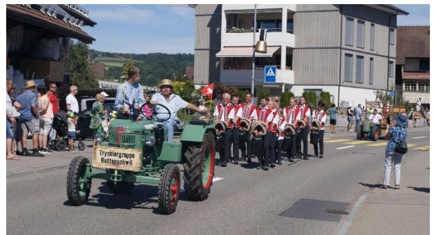
Der Höhepunkt war der Trychlerumzug am Samstag.

Wir sind sehr stolz, diese drei Tage ohne Zwischenfall und äusserst friedlich über die Bühne gebracht zu haben. Dies zeigt uns einmal mehr, dass wir mit unseren Trycheln und der Verbundenheit zur Folklore viele Fans und Gleichgesinnte auf unserer Seite haben.