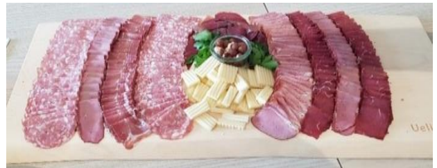
Ein feines Apéroplättli

Dort gab es eine Besichtigung mit Fleischkunde und möglichem Einkauf. Nach der Führung und dem Einkauf durften wir noch einen Aperó zu uns nehmen, bis es dann weiter ging in die Wirtschaft Trumpf-Buur.