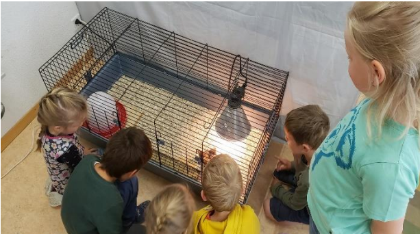
Gespannt beobachteten die Kinder die Entwicklung vom Ei zum Küken.

In dieser Zeit stand im Kindergarten ein Brutkasten mit Eiern, aus denen unter den staunenden, interessierten Augen der Kindergartenkinder winzige Küken schlüpften, die sich erstaunlich schnell zu Hühnchen entwickelten. Als es langsam zu eng wurde im Käfig, wurden sie auf einen Bauernhof gebracht.