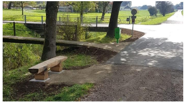
Neue Bank beim Steg Seematten

Im nächsten Jahr ist geplant, die alten Holzbänke an den Bushaltestellen durch neue Bänke in einheitlichem Konzept zu ersetzen.