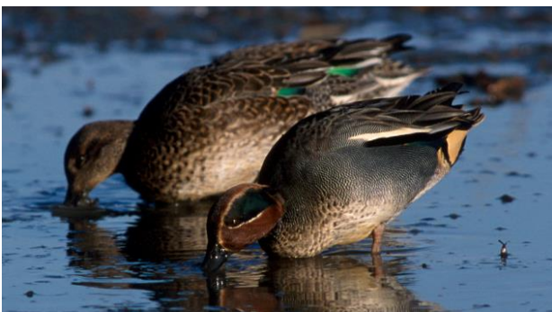
Ein Krickenten-Paar gründelt im Flachwasser.