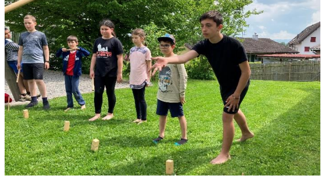
Der Spiel- und Sporttag begeisterte alle.

Im Mai waren am Spiel- und Sporttag alle begeistert dabei, sich im Laufen, Weit- und Hochspringen, im Werfen und an unterschiedlichen Plauschposten zu messen und zu vergnügen.