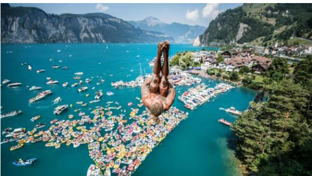
Sprünge bei einmaligem Panorama

mit allen Kräften, um zu einem guten Gelingen beizutragen. Im Verlaufe des späteren Nachmittags wurde abgelöst, und wir hatten als Lohn freien Zugang zum Event wie der Party, welche noch bis am Sonntagabend andauern sollte.