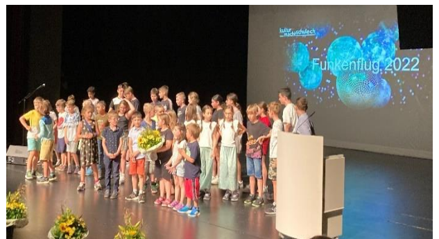
Die Funkenflug-Preisfeier fand in Baden statt.

Uns erreichte auch eine tolle Nachricht! Wir wurden darüber informiert, dass wir mit unserem schulübergreifenden Kunstprojekt «Gross-Klein» einen über CHF 5'000 dotierten Preis gewonnen haben! Also fuhren alle Kinder und Lehrerinnen in einem extra für diesen Anlass gecharterten Bus nach Baden zur Funkenflug-Preisfeier, auf der die Kinder ihre Projekte dem Publikum vorstellten und den Preis entgegennahmen.