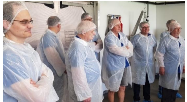
Interessierte Köche bei der Besichtigung.

Der Präsident stellte eine Reise zusammen. Es ging mit einem kleinen Bus nach Ebikon zur Bio-Metzgerei Ueli Hof AG: Echter Geschmack im Einklang mit Mensch, Tier und Umwelt. Weitere Informationen zur Metzgerei findet Ihr unter: www.uelihof.ch .