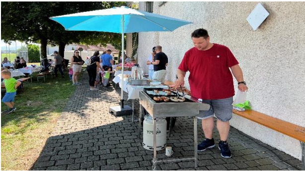
Der Spiel- und Spassnachmittag war ein toller Event.

Und natürlich steht für Euch auch noch einiges für die kommende Zeit auf dem Programm - es wird ein Adventsbasteln geben, Lebkuchen werden verziert und auch eine offene Turnhalle ist geplant... Details zu den bevorstehenden Veranstaltungen findet ihr auf unserer Website.