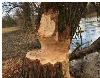
An der Reuss fühlt sich der Biber wohl.

Sanduhrförmig angenagte Bäume, aufgestaute Bäche, Trampelpfade und Biberburgen – der Biber ist definitiv zurück im Reusstal! Wir begeben uns gemeinsam auf Spurensuche und erfahren, weshalb der Biber Bäume fällt, orange Zähne hat und im Winter im Wasser nicht friert.