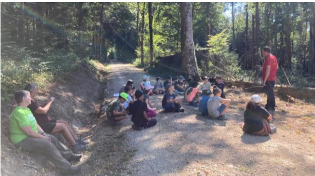
Die Mittelstufe besuchte drei Workshops an den Aargauer Waldtagen.

Die Mittelstufe begab sich nach Unterentfelden, wo die Aargauer Waldtage stattfanden. Dort besuchten sie drei Workshops und sahen dabei die Arbeit von Rettungshunden im Wald, bauten Pfeil und Bogen aus Holz und erfuhren beim Förster, wie vielfältig der Rohstoff Holz verwertet wird.