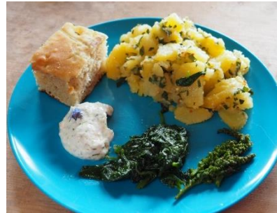
Eine feine Mahlzeit aus und mit Wildkräutern.