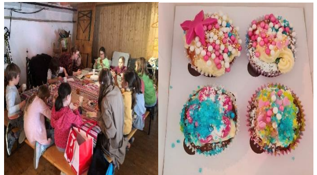
Es wurden Osternestchen gebastelt und Cupcakes dekoriert.

Im Frühling haben wir Osternestchen gebastelt und Eier bemalt und es gab einen tollen Backnachmittag, wo leckere Cupcakes hübsch dekoriert wurden.