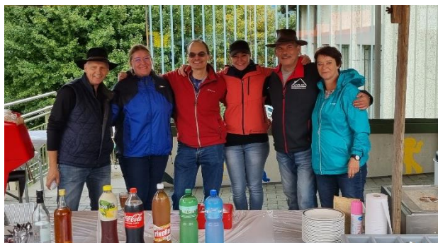
Der neue Vorstand des Kulturvereins.