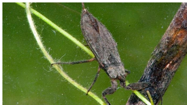
Der Wasserskorpion gehört zu den Wasserwanzen und ist ein Lauerjäger.