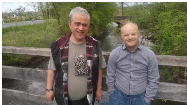
Zwei Klienten auf einem Ausflug.

Und jetzt zu dir: als ich dich kennenlernte habe ich gemerkt das du uns nimmst wie wir sind. Wo Hilfe nötig war hast du es mit ganz viel liebe gemacht. Deinen garten mit vielen früchten habe ich mit erstaunen bewundert. Alex (ein Feriengast, der Name wurde geändert) war sehr gesprächig und hat mir auch manchmal viel erzählt. Die Zimmer waren schön und haben einem ruhe gegeben. Deine Katze hat mir am besten gefallen. Sie war am anfang zutraulich hat aber schnell gemerkt das ich Katzen liebe. Dein altes Haus strahlt viel ruhe und geborgenheit aus. Pflege es wenn nötig das es immer ein Haus ist für viele tolle Gäste. Am Schluss von dieser Woche hat Mia (die Katze) sich auf den tisch gelegt und wir haben ihr schönes fell gestreichelt.