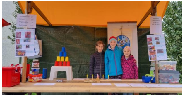
Für Spiel und Spass war gesorgt.