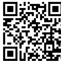
Scannen Sie den QR-Code um direkt zum Smart Service Portal zu gelangen.

Dem Newsletter der Fit4Digital GmbH vom 13. Oktober 2022 war zu entnehmen, dass die Gemeinde Rottenschwil mit 14.1 getätigten Bestellungen pro 1'000 Einwohnerinnen und Einwohner den dritten Platz der Aargauer Gemeinden mit den meisten Bestellungen über das Smart Service Portal erreichte.