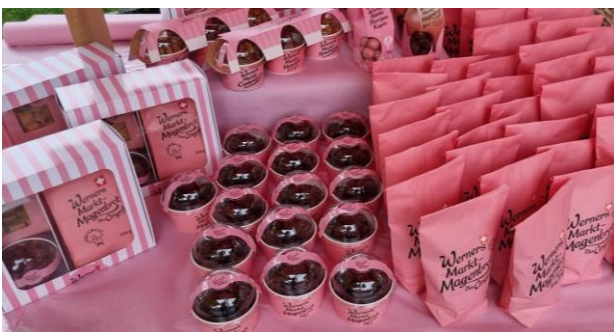
Marktsüssigkeiten sind bei Gross und Klein beliebt.

Am 24. September 2022 fand der diesjährige Herbstmarkt statt. Das Wetter zeigte sich bereits herbstlich nass und kühl. Nichtsdestotrotz mit geeigneter Kleidung oder einem Regenschirm wagten sich Jung und Alt auf den Pausenplatz. Der organisierende Kulturverein bot neben Kürbissuppe, Wienerli und Brot auch Getränke und Kaffee an.