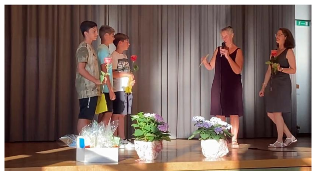
Die Verabschiedung der Sechstklässler erfolgte anlässlich der Schulschlussfeier.